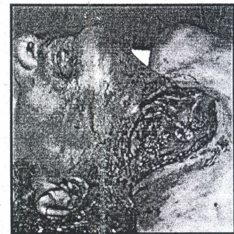
බෙල්ලේ කැපුම දකුණු පැත්තෙන් පෙනෙන අයුරු

බෙල්ලේ ඉදිරිපස ඇලට පිහිටි ගැඹුරු කැපුමක් තිබුණි. එහි වම් කෙළවර බෙල්ලේ ඉහල කොටසේ වම් කනට පහලින් ආරම්භ වී තිබුණි. එතැන් සිට එය ගැඹුරු වී දකුණු පසට යන්නට ක්‍රමයෙන් ගැඹුරු අඩුවී යනු පෙනුණි. අනෙක් කෙළවර බෙල්ලේ දකුණු පැත්තේ, බෙල්ලේ මැද කොටසෙහි පිහිටි අතර එය කෙළවර වූයේ සිහින් දිගැති සිරිමකිනි.